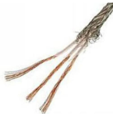
МГТФЭ экранированный 3 жилы