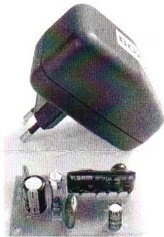
Рис.1 Общий вид устройства Описание работы

Общий вид устройства представлен на рис. 1, схема электрическая принципиальная – рис. 2.