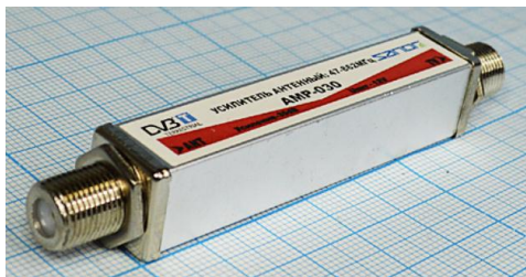
Артикул Q-7100 Б