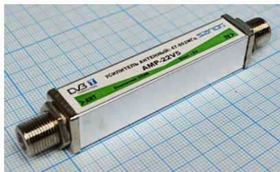
Артикул Q-7100 А