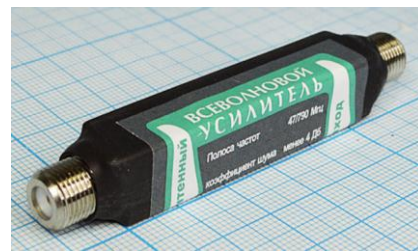
Артикул Q-7100 В

Предназначены для усиления телевизионных (ТВ) сигналов метрового и дециметрового диапазонов волн (1–69 ТВ каналы) цифрового и аналогового телевидения. Используются для компенсации потерь (затухания) сигналов в кабеле снижения индивидуальных и коллективных антенн. Устанавливаются усилители в разрез кабеля с помощью F-разъёмов ближе к антенне.